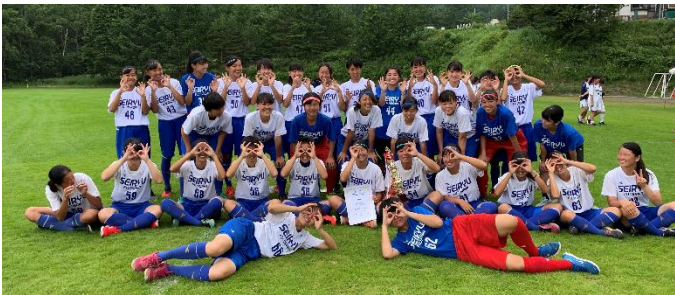
(写真は女子サッカー部草津合宿の様子)